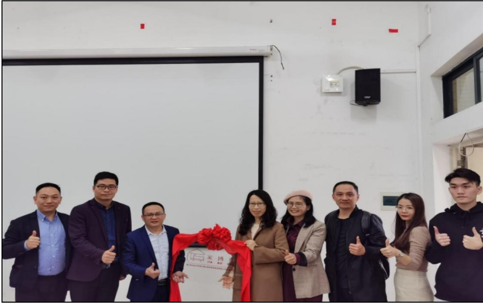
图一 第一届“家博社”成立仪式