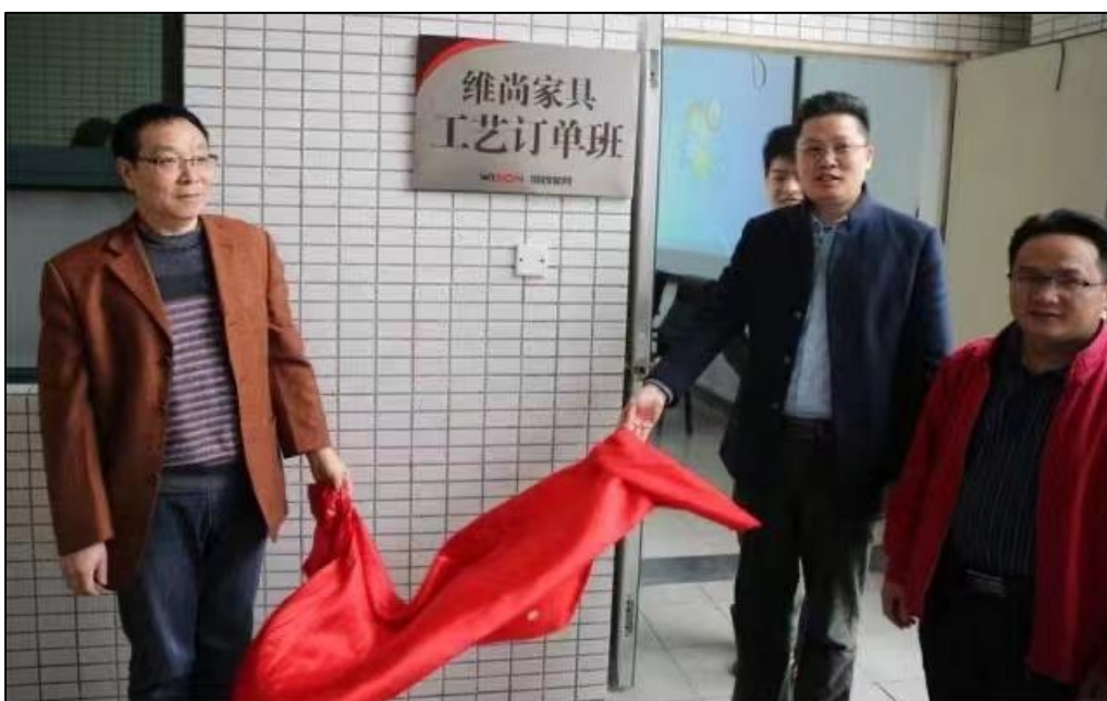
图九 维尚订单班开班仪式

订单班通过学校、企业深度合作，教师、师傅联合传授，对学生以技能培养为主的现代人才培养模式。更加注重技能的传承，由校企共同主导人才培养，设立规范化的企业课程标准、考核方案等，体现了校企合作的深度融合。整合学校、佛山维尚家具制造有限公司双方的资源优势，初步构建了工业设计订单班人才培养模式，以旅游景区企业岗位（群）职业能力为依据，培养适应现代制造业需要的，具备景区管理人员职业技能和较强的可持续发展的能力，具有良好职业道德和工匠精神的技术技能型人才。