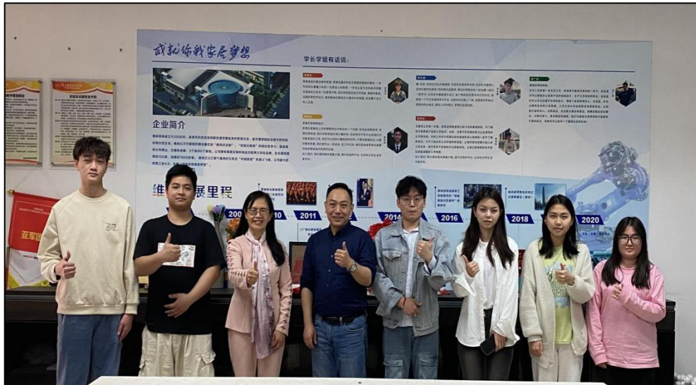
图二 第二届“家博社”社长、部长与指导老师