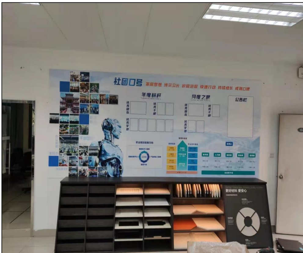
图八 维尚捐赠的维尚设计创意中心