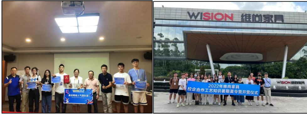
图三 维尚夏令营活动