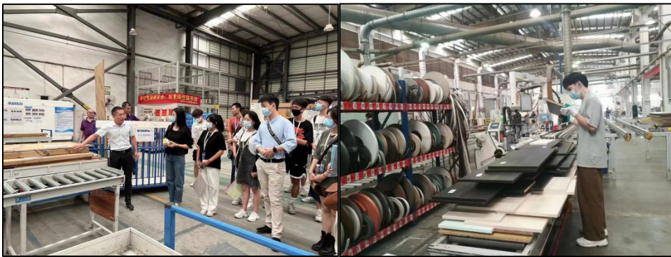
图四 维尚工艺技术方向系统的进阶式学习训练

开展工艺技术方向系统的进阶式学习训练营，由工艺技术中心技术骨干开展线上线下的授课，为师生带来含金量十足的家具工艺知识课程。让学生掌握行业最新资讯和企业用人需求，为企业前置培养关键岗位人才。